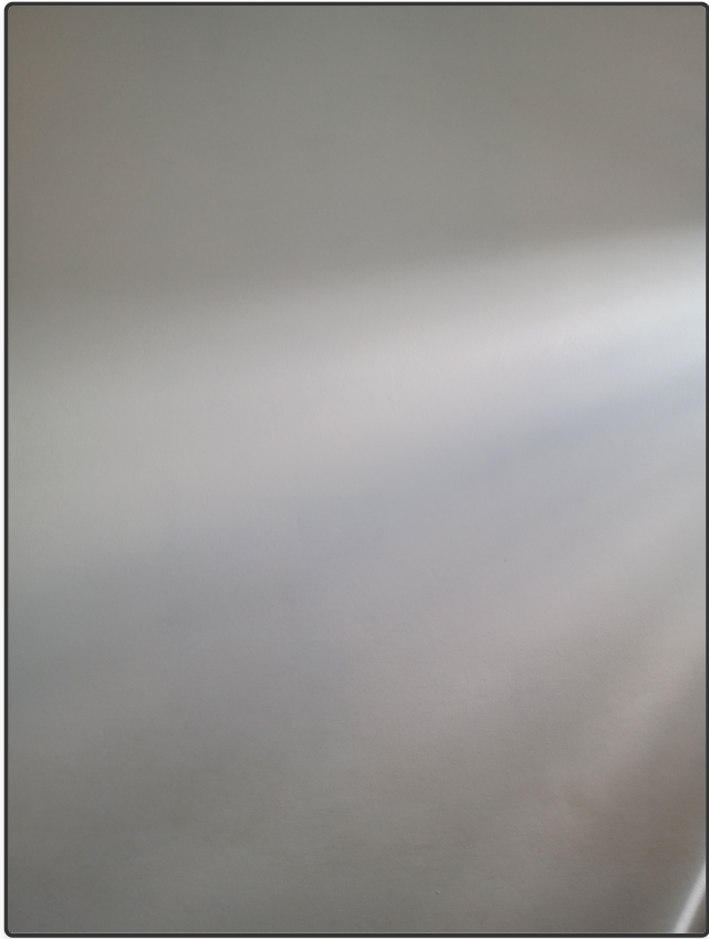
Imagem 1 de 4