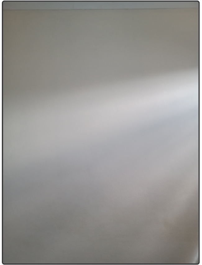
Imagem 2 de 4